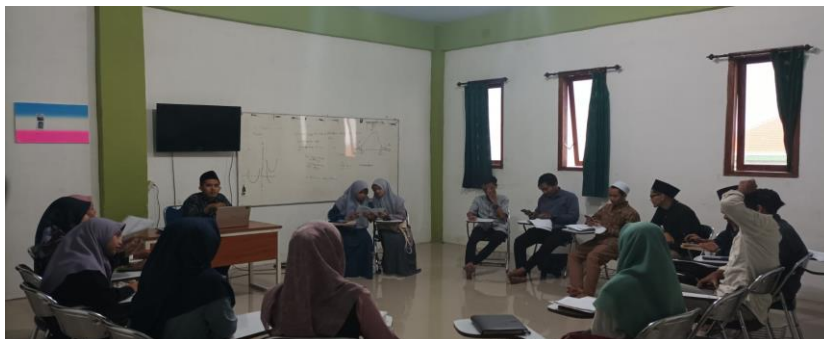
Gambar : 1

Pengabdian ini diawali dengan adanya persiapan yang diklasifikasinya ke dalam dua macam, yaitu persiapan di ruang perkuliahan dan persiapan ketika akan terjun ke lokasi kegiatan. Adapun detail tahap persiapan ini meliputi hal berikut ini: a). Dosen membekali mahasiswa dengan mata kuliah Al-Qur'an dan Isu Moderasi. Kegiatan dilakukan di kampus IKHAC sebelum mahasiswa terjun ke lapangan. b). Dosen mengajak mahasiswa untuk mengobservasi lokasi pengabdian, yaitu menemui pihak-pihak terkait: Ketua yayasan, takmir Masjid Al-Hidayah, pengurus Remas Al-Hidayah Karangpilang. c). Kemudian dosen melibatkan mahasiswa untuk mengidentifikasi masalah/kebutuhan yang dihadapi Remas AL-Hidayah. Kegiatan ini dilakukan dengan cara mahasiswa melibatkan diri dalam kegiatan komunitas Remas Al-Hidayah Karangpilang. d). Berikutnya adalah mengagendakan FGD. Kegiatan ini direncanakan dilaksanakan di Masjid Al-Hidayah dengan melibatkan dosen, mahasiswa, takmir Masjid Al-Hidayah, pengurus dan beberapa anggota Remas Al-Hidayah. Kegiatan ini dimaksudkan untuk menyampaikan hasil observasi dan merumuskan rencana tindakannya.