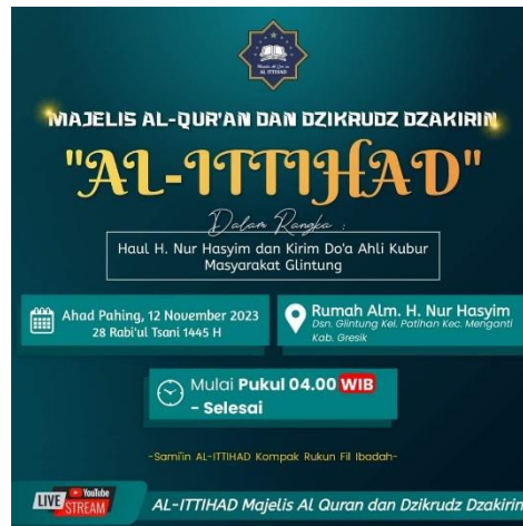
Gambar 2 Publikasi Majelis Al-Ittihad di Media Sosial.

Untuk pemilihan lokasi acara dan sobibul bajat (tuan rumah), pengurus internal menunjuk seseorang untuk menjadi giliran selanjutnya. Penunjukkan ini biasanya didasari oleh faktor kekerabatan dan jaringan Al-Ittihad. Namun, tak jarang pula Jemaah yang menawarkan diri untuk sekalian mengadakan hajatan kirim doa seperti yang tertera dalam gambar berikut: