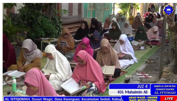
Gambar 4 Tampak jemaah perempuan menyimak dengan khidmat.

Adapun untuk jemaah yang hadir dalam majelis simakan Al-Quran, mayoritas adalah masyarakat sekitar. Jika dua elemen di atas seluruhnya diisi oleh laki-laki. Maka, dalam elemen inilah jemaah perempuan mulai terlihat. Kegiatan para jemaah di sini sifatnya 'tidak terikat'. Mereka bebas melakukan apapun di tengah pendarasan Al-Quran. Sesekali mereka turut menyimak sembari membuka Al-Quran yang telah disediakan dan sesekali berbincang dengan jemaah lainnya.