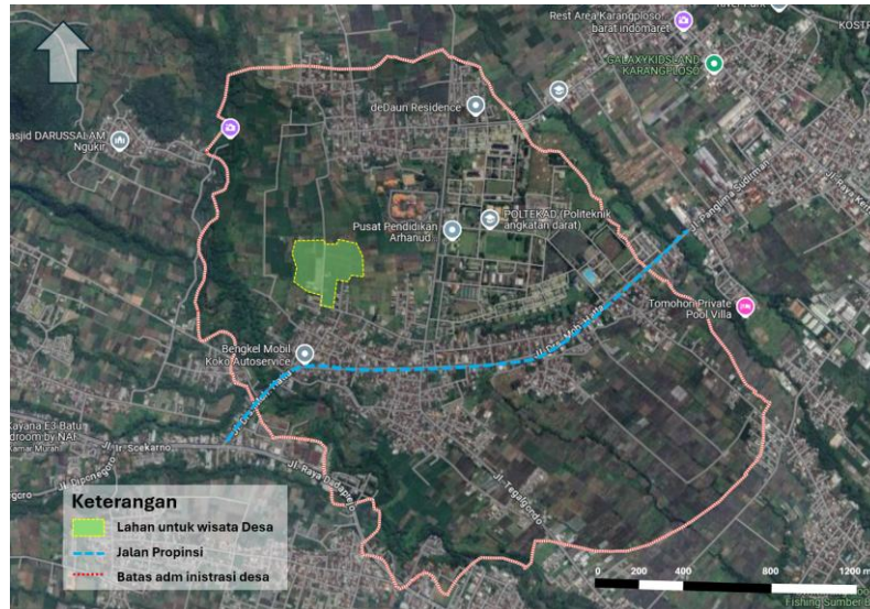
Gambar 2. Batas Administrasi Desa Pendem, Kecamatan Junrejo, Kota Batu

Sejauh ini, Desa Pendem belum terlibat secara aktif untuk dikembangkan sebagai tempat tujuan wisata. Letaknya yang strategis dengan frekwensi lalu lintas kendaraan bermotor yang sangat tinggi, maka sudah selayaknya Desa Pendem berbenah diri sehingga dapat menjadi salah satu tujuan wisatawan yang singgah ke Kota Batu atau ke Kota Malang. Untuk sementara, konsep yang ditawarkan adalah menjadikan Desa Pendem sebagai daerah penyangga kawasan wisata utama di Kota Batu dan Kota Malang.