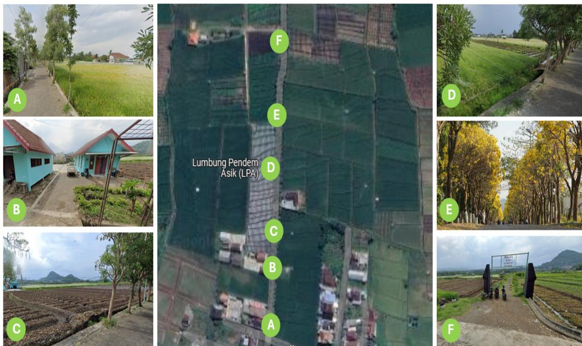
Gambar 4. Foto Mapping Sekitar Lokasi Lahan Untuk Pengembangan Wisata Desa Pendem

tempat wisata yang ingin dikembangkan 15, 16 . Bagaimana dengan Desa Pendem, potensi apa saja yang dimiliki oleh Desa Pendem, Kecamatan Junrejo, Kota Batu. Desa Pendem memiliki atraksi budaya tahunan yang masih bisa ditingkatkan menjadi pertunjukan seni yang ditampilkan berkala, mingguan atau bulanan. Desa Pendem juga terkenal dengan keberadaan pohon tabebuya yang berada di sepanjang jalan utama di Desa Pendem (lihat gambar 4 foto E).