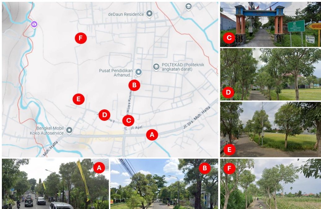
Gambar 3. Foto Mapping Jaringan Jalan Yang Tersedia di Desa Pendem

Gambar 3 di atas merupakan kondisi eksisting aksesibilitas yang dimiliki oleh Desa Pendem. Lebar jalan bervariasi, mulai dari 1.5 m sampai dengan 12 m dengan perkerasan makadam, paving, beton dan aspal. Kondisi ini tentu berdampak langsung terhadap kesiapan Desa Pendem untuk menyambut volume kendaraan dengan frekwensi yang tinggi, jika Desa pendem menjadi lokasi tujuan wisata baru di Kota Batu. Kebutuhan ruang lainnya tentu terkait area kendaraan bermotor atau area parkir sepeda motor atau mobil, bahkan bis pariwisata 14 . Sedangkan kebutuhan-kebutuhan lain menyangkut ketersediaan lahan sebagai tempat wisata buatan dan atau atraksi, tempat makan seperti pujasera, warung nasi dan restoran, toko penjualan souvenir, dan fasilitas penunjang lainnya seperti tempat ibadah berupa masjid atau musholah, toilet, kantor pengelola dan sebagainya.