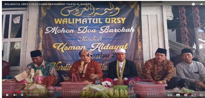
Gambar 2. Tampilan konten youtube dakwah Habib Muhammad Taufiq Al-Djufri dalam acara Walimatul Ursy

Konten youtube “Walimatul Ursy Oleh Habib Muhammad Taufiq Al-Djufri” merupakan konten yang berdurasi kurang lebih dua puluh dua menit, agar lebih detail, peneliti akan menampilkan narasi materi ceramah pada video tersebut dalam bahasa madura :