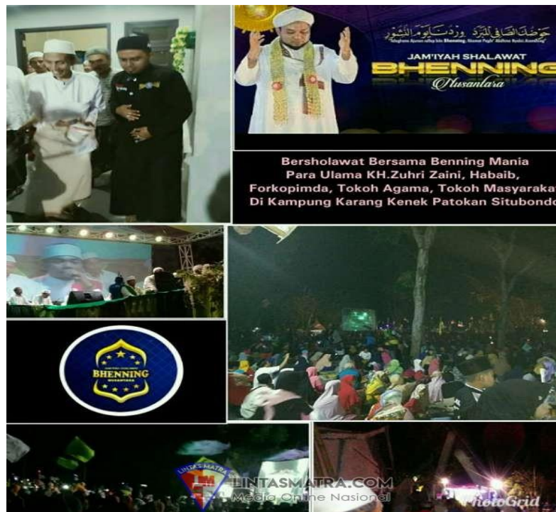
Gambar 1. Pengajian Jam'iyah Bhenning Sholawat secara langsung

menegaskan bahwa modernisasi dakwah tidak berarti meninggalkan warisan masa lalu, melainkan mengolahnya menjadi sumber daya spiritual yang dapat menjawab tantangan zaman. Untuk memudahkan pembaca, kami sajikan hasil dokumentasi di bawah ini :