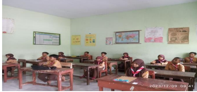
صورة ١: عملية الاختبار البعدي

نظرا للجدول ١، كانت الطلاب متحمسين أثناء استماعهم للمعلم في اللقاء الرابع. في هذا اللقاء الرابع، تم إجراء الاختبار لتقييم كفاءة مهارة القراءة لدى كل طالب بعد إجراء تعليم اللغة العربية باستخدام وسيلة البطاقة خلال ثلاث جلسات دراسية وجهاً لوجه. ببطء، تقدم كل طالب بشكل فردي لإجراء هذا الاختبار وفقاً لترتيب الحضور. يمكن تلخيص لنتائج اختبار اللغة الشفوية قبل إجراء تعليم اللغة العربية باستخدام وسيلة البطاقة وبعد إجراء الدروس باستخدام وسيلة البطاقة من خلال الجدول ٢ التالي: